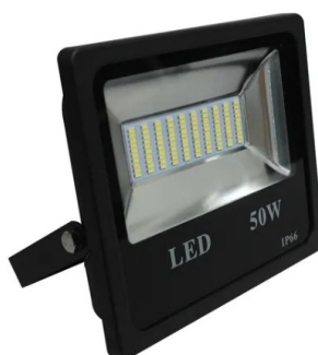
Figura 03 – Refletor de LED 50W

Secretaria de Estado da Educação de Goiás